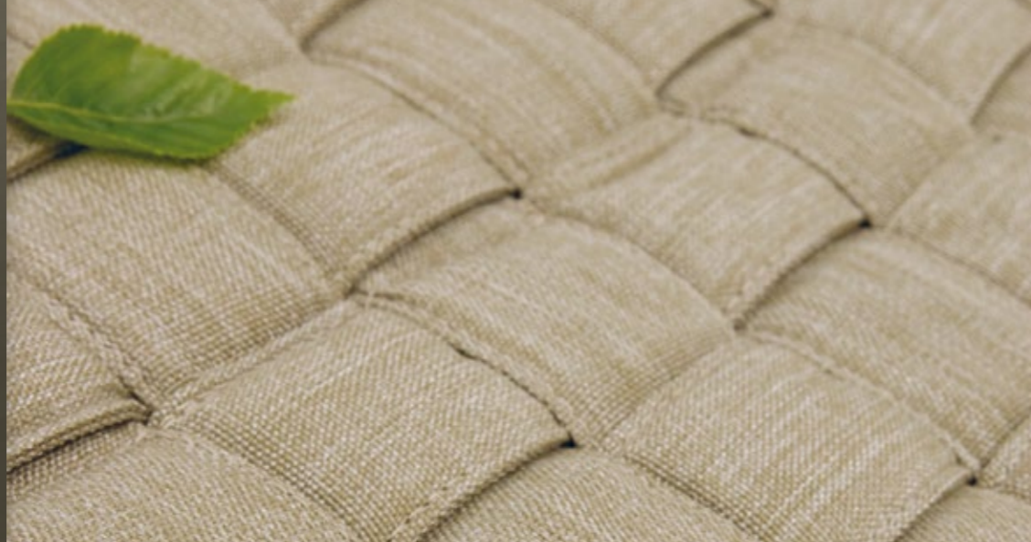
DOPPEL-STABHÄNGEMATTE LOUISIANA crocodile NBR14-44

HamacTex®, witterungs- beständige Funktionsfa- ser (Polypropylen), hohe Licht- und Waschecht- heit, schnell trocknend.