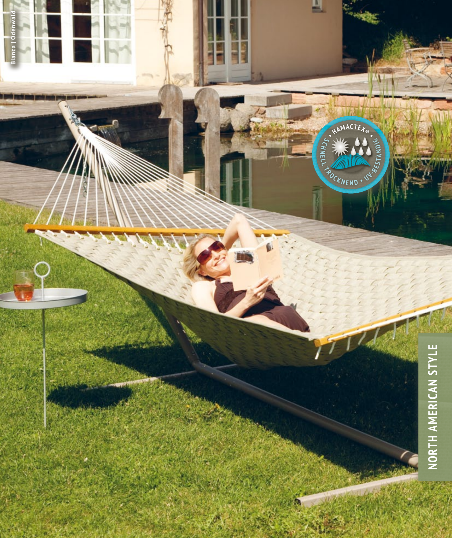
Bianca | Odenwald